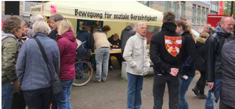
Infostand am Tag der Arbeit am Osnabrücker Gewerkschaftshaus.

Mit dem Schwerpunkt „biblische Berufstätige“ konnten Besucher am ökumenischen Stand am Kollegienwall in einem aktiven Persönlichkeitstest herausfinden, ob sie eher Paulus, Maria oder anderen Persönlichkeiten aus der Bibel von ihrer Arbeitsweise her ähneln. Durch die Aktionen wurde deutlich, dass die Themen Arbeit und Glaube für die Verbände selbstverständlich zusammengehören. Daher engagieren sich die christlichen Verbände in Politik und Arbeitswelt. Sie fordern in einer Zeit der schnell fortschreitenden Entwicklung in