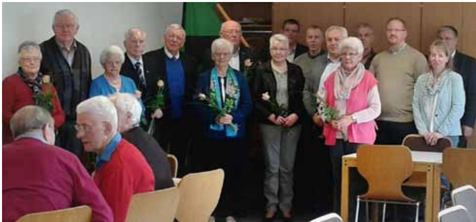
Jubilarehrung bei der KAB St. Marien Biene

Jahreshauptversammlungen in Nordhorn und Biene