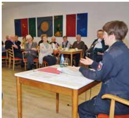
Interessierte Zuhörer bei einem spannenden Vortrag

Schicksal berührt. Oft sind mehrere Betrüger gleichzeitig beteiligt. Dabei gehen sie in ‚Arbeitsteilung‘ vor. Während einer sein Gegenüber in ein längeres Gespräch verwickelt, hat ein anderer längst einen Hintereingang gefunden und durchsucht die Räume nach Wertgegenständen.