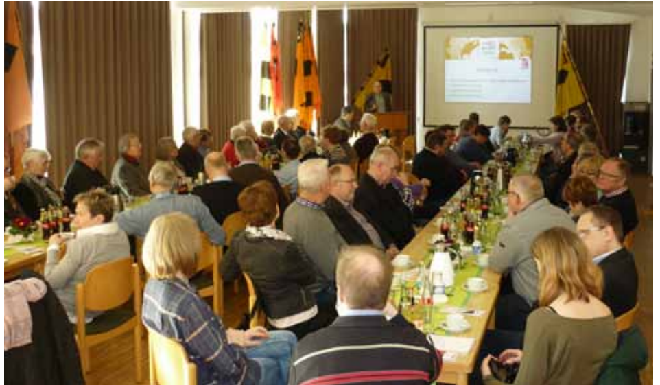
Aufmerksame Zuhörer beim Josefsempfang in Bramsche

Josefsempfang des Bezirksverbands Osnabrück in Bramsche