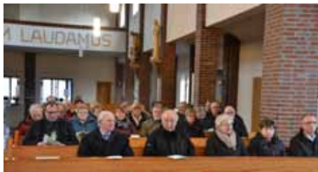
Einstimmung auf ein komplexes Thema in der Christus-König-Kirche in Dalum

In einer Veranstaltung zum Thema „Missionarische Kirche“ informierte Präses Altmeppen über Pläne des Bistums, wie in Zukunft eine lebendige Gemeinde funktionieren könnte. Ziel ist dabei, die bestehenden Pfarreien oder Pfarreiengemeinschaften nicht noch größer werden zu lassen. Die Gemeindeleitung soll durch hauptamtliche Laien, also pastorale Mitarbeiter, wahrgenommen werden. Das Kirchenrecht ermöglicht diesen Schritt, wenn es nicht genügend Priester zur Leitung der Gemeinden gibt. Dem Pfarrbeauftragten steht in seinen Aufgaben ein moderierender Priester zur Seite, der nicht vor Ort